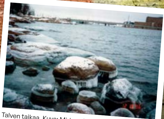
Talven taikaa.