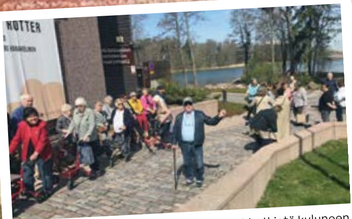
Kiitämme asukkaita mukavista yhteisistä hetkistä kuluneen vuoden aikana.

Hyvää Joulua ja onnekasta Uutta Vuotta toivottaa Senioritalon Ystävät