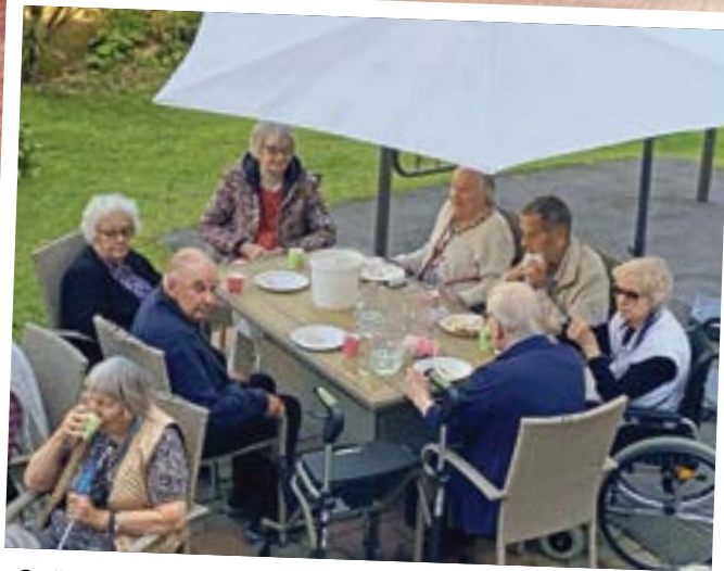
Grillimakkaraa ja yhdessäoloa.

Lauttasaaren senioritalo kiittää Spondaa. Järjestämme taulujen luovutustilaisuuden myöhemmin joulukuussa.