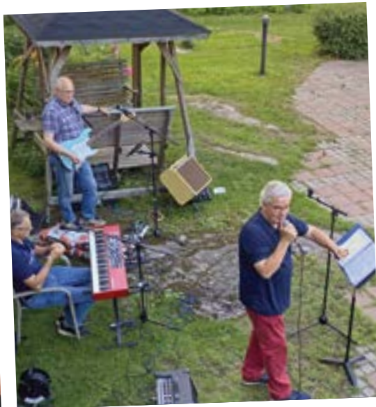
Senioritalon Ystävien järjestämän Makkarailan musiikillista tunnelmaa!