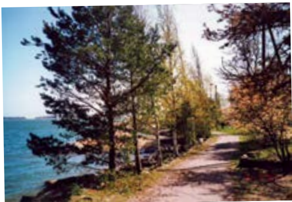
Viihtyisä rantatie kutsuu ulkoiluun.

Hyvää Joulua ja onnekasta Uutta Vuotta toivottaa Senioritalon Ystävät