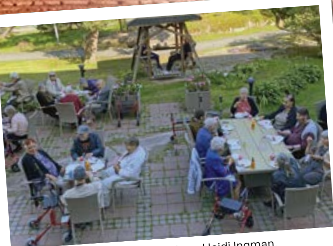
Leppoisasti elokuun illassa.