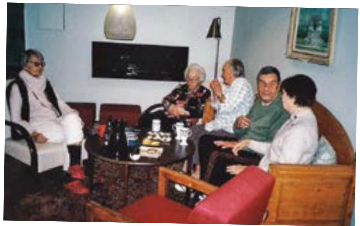
Nimipäivän vietossa.